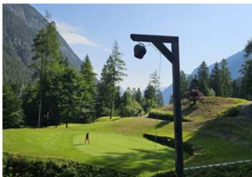
Kratší, ale herně i vizuálně atraktivní GolfClub Brand

GolfPark Bregenzerwald leží od Lechu něco málo přes hodinu cesty. Užijete si desítky zatáček v nádherné alpské oblasti a klesání z 1600 metrů skoro o kilometr níž. Hřiště se rozprostírá v údolí říčky, jedenáct jamek na jedné a zbytek na opačné straně. Jamky mají zvlněný profil, stále se stoupá a zase klesá, byť ne tak prudce jako na předchozích hřištích. Osvěžující je pasáž mezi pátou a sedmou jamkou okolo jezera. Otevřené jamky se střídají s těmi okolo lesa. Často velmi zvlněné fairwaye a nakloněné greeny jsou velkou výzvou. Stejně jako ta předposlední, táhlý pětipar hraný do kopce, který začíná lesním průsekem.