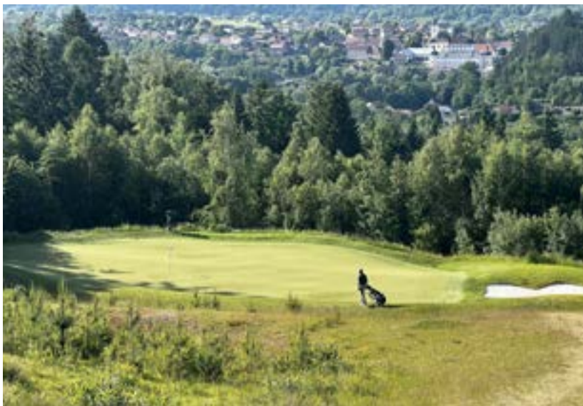
Osamělost hráče Challenge Tour u sedmého greenu devítky Forest

Mezi příznačné rány patřily ty na devítce Meadows, krátkém čtyřpa-