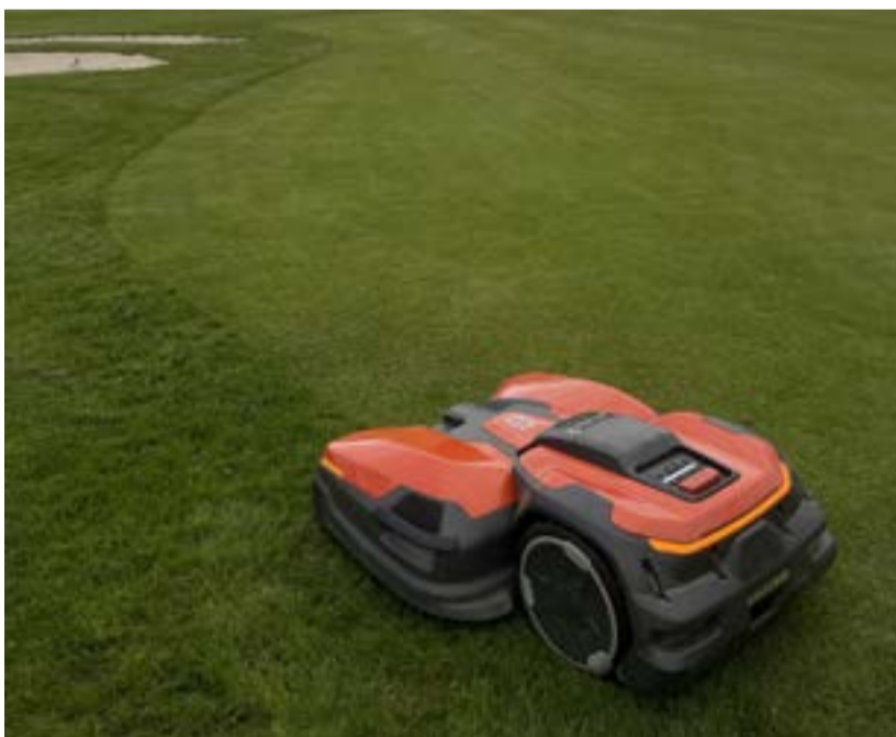
Sekačka v Bechyni pracuje