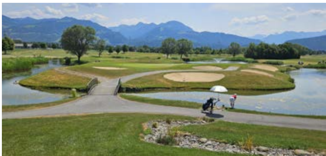
Výhled z vyvýšené klubovny na poslední green v Golfpark Rankweil