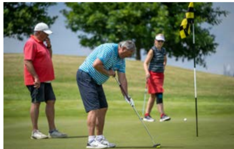
Antonín Panenka hraje golf už mnoho let. Odpusťte mu to fotbaloví fanové?

Krásné pozemky v přírodě u lesa 5 minut od sjezdu z dálnice D3