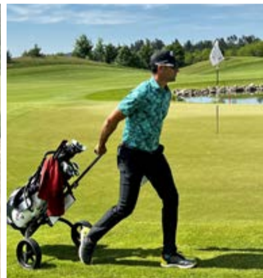
Álvaro QUIROS, Španělsko: Alfred Dunhill 2006, Portugal Masters 2008, Qatar Masters 2009, Open de España 2010, Dubai Desert Classic 2011, Dubai World Championship 2011, Rocco Forte Open 2017