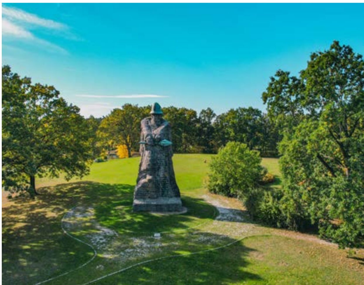
Socha Jana Žižky u Sudoměře