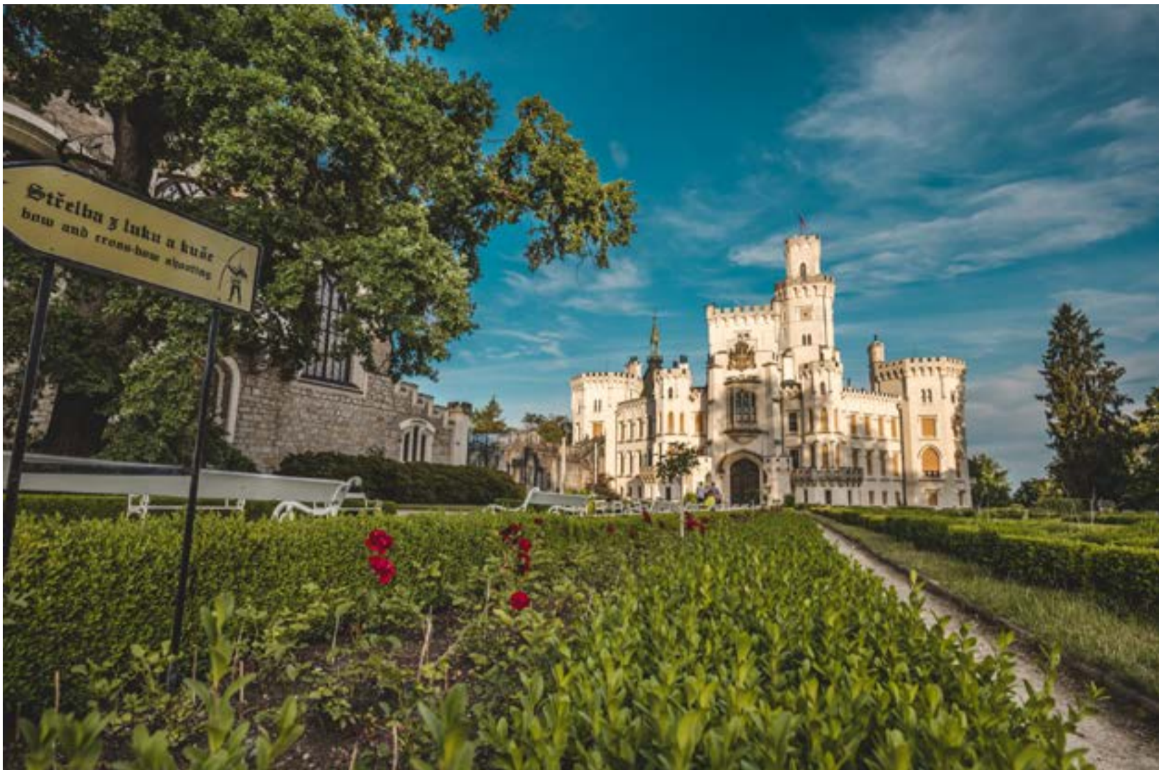
Státní zámek Hluboká láká po celý rok

Dovolená v Českém Krumlově jednoznačně velí okusit také něco z přírodních a historických úkazů za hranicemi města. Jedna z nejrozsáhlejších středověkých památek čeká hned za humny. Na vysokém ostrohu nad soutokem Vltavy a Křemežského potoka je zřícenina hradu Dívčí kámen . Překrásná příroda i těsná blízkost keltského opida činí z romantické zříceniny výletní cíl, který si nemůžete nechat ujít. Ještě o něco blíže ze Svachovy Lhotky to je do místa vyznačujícího se jakousi zvláštní poklidnou atmosférou. Na kopečku obklopeném ze tří stran řekou Vltavou stojí půvabný cisterciácký klášter Zlatá Koruna , jeden z nejcennějších komplexů gotické architektury ve střední Evropě.