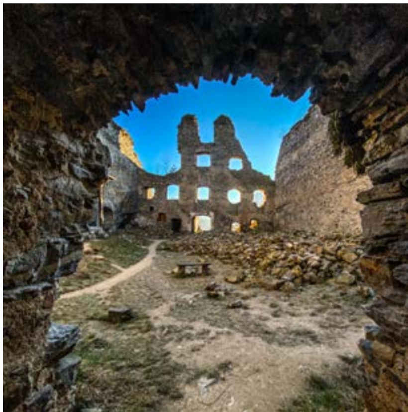
Zřícenina Dívčí kámen