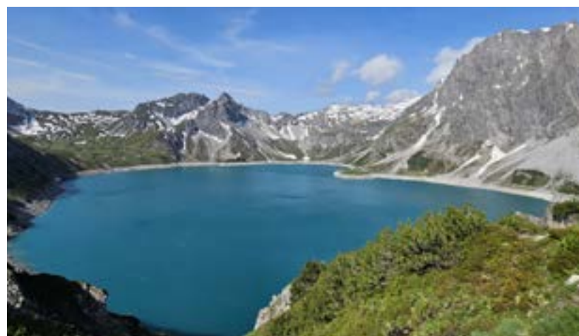
Jezero Lünensee

Z Prahy do hlavního vorarlberského města Bregenz při cestě kolem Mnichova a přes Memmingen trvá cesta po dálnici necelých šest hodin. Valavíer Aktivresort v městečku Brand je skvělým místem pro několikadenní pobyt. Z okna pokoje nebo z prosklené sauny se díváme přímo na úvodní jamku hřiště AlpinGolf Brand . Naproti hotelu máte stanici lanovky (jízdné je zdarma v kartě, kterou dostanete k pobytu). Za pár minut jízdy s jedním přestupem se dostanete do říše klidu a kvetoucích luk. Nechte si ujit výlet k jezeru