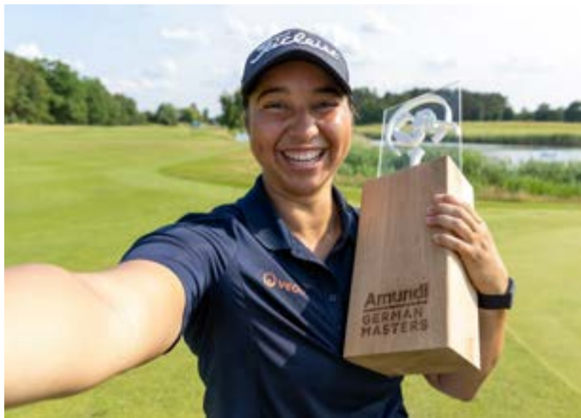
S trofejí vítězky German Masters

Šla jsem do play off s vědomím, že soupeřka do té doby hrála skvěle, jenom neproměňovala šance na greenu, kdežto já se naopak při hře v poli bránila a zachraňovala se krátkou hrou a putty. Řekla jsem si, že tomu dám všechno. Když jsem ještě vedla na šestnácté jamce, přemýšlela jsem, že bych asi měla začít trénovat vítěznou řeč. Jenže po dražvu na osmnáctce hybridem do roughu, jsem si uvědomila, že to byly hodně předčasné myšlenky.