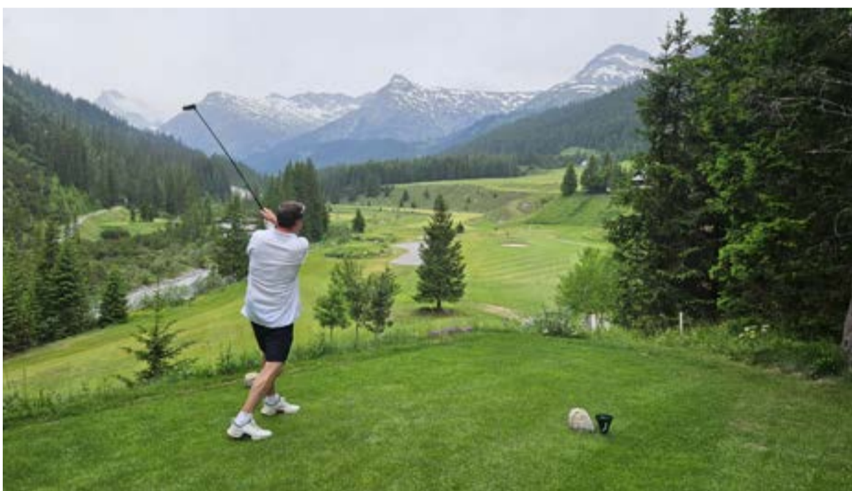
První odpaliště GC Lech am Arlberg je nejvyšším bodem rakouského golfu (1550 m.n.m.)

„Druhá devítka je vizuálně atraktivnější, zejména závěr od čtrnácté jamky. Ta se hraje na ostrovní green,“ dodává doprovod Rainer. „Často zde fouká od severu, což dělá některé jamky snadné, ale třeba na třináctce (378 metrů) si proti větru neškrtnete,“ dodává. Naopak patnáctka, 453 metrů a par 5 (pokud s větrem, tak skoro vždy v zádech) je naopak birdie jamkou.