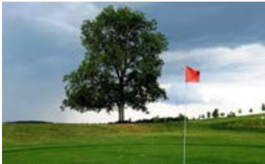
Green druhé jamky s nádherným solitérním ořechem