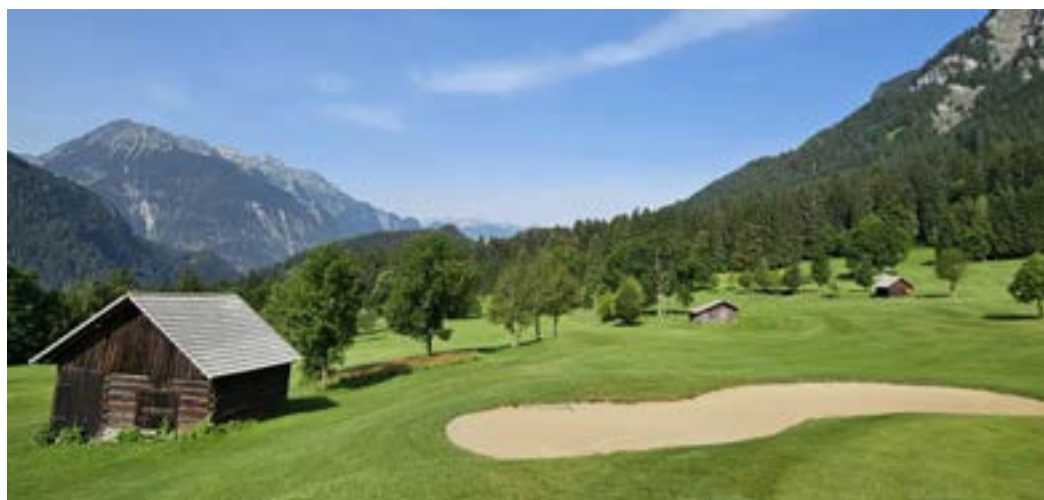
Úvodní devítka GolfClub Bludenz-Braz je ve znamení stoupání podél seníků