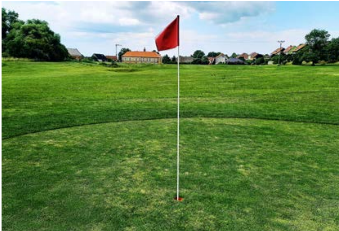
Green čtvrté jamky se zámečkem v pozadí

a vysvětluje, že driving žije s hřištěm v symbióze a není tu přelidněno. „Máme samoobslužný provoz. Celodenní vstup na driving a akademii 100 korun lze dát do kasičky u vý-