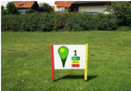
Odpaliště jsou skromná, ale dostačující

V tréninkovém centru najdete akademii s šesti přírodními jamkami: pět parů 3 od 89 do 147 metrů a par 4 dogleg s délkou 234 metrů. Hřiště částečně leží na drivingu (jamky 1, 2 a 6) a pokračuje za valem (3, 4 a 5). K dispozici je 350 metrů dlouhý driving se šesti odpališti. Putting green o rozloze 230 m 2 je osazen pěti tréninkovými jamkami. Hřišti