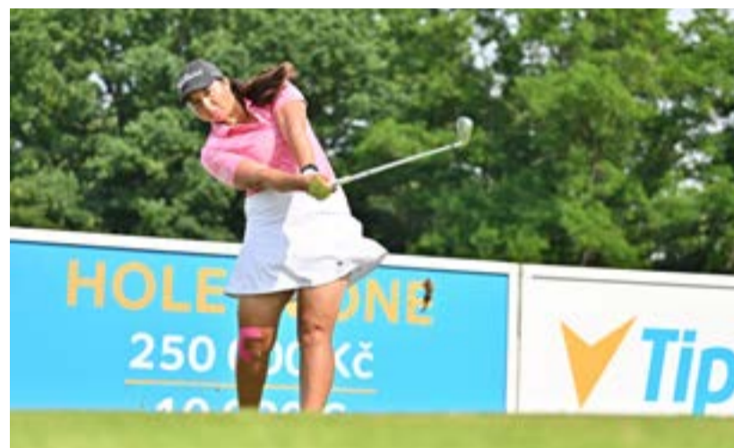
Na Tipsport Czech Ladies Open

Dostala jsem druhý záznam a ten třetí by znamenal pokutu pět set eur. Jsem smířená s tím, že to stejně někdy přijde. Hlavně jsem se bála, aby nepřišla trestná rána. Myslím ale, že problém není ve mně, ale v pomalých spoluhráčcích. Třeba v Keni